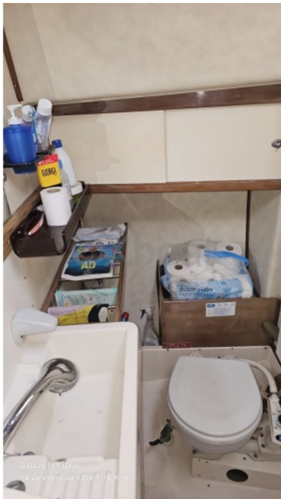
Galaxy S25 Ultra 6 de enero de 2024 9:14 a. m.