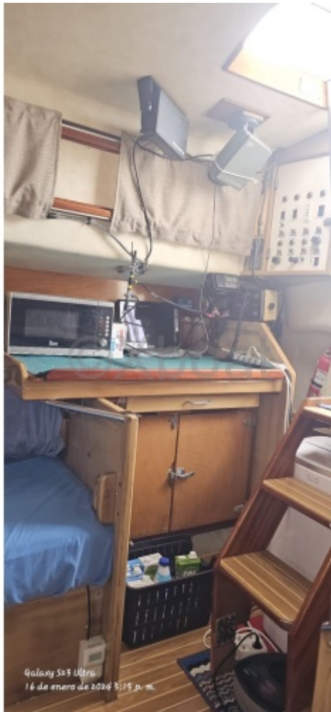
Galaxy S23 Ultra 14 de enero de 2024 5:15 p. m.