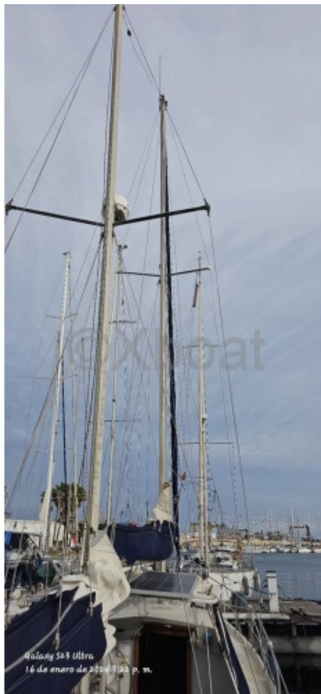
Galaxy 523 Ultra 14 de enero de 2024 3:00 p. m.